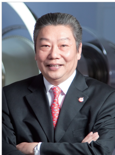
林左鸣 中国航空工业集团公司董事长。

2008年，中央决定对中国航空工业实施战略性重组，新组建的中国航空工业集团公司于2008年11月6日注册成立。五年来，中航工业按照中央关于推进航空工业改革发展的重大部署，肩负“航空报国、强军富民”的神圣使命，深刻把握世界航空工业发展的科学规律，确立并全面实施“两融、三新、五化、万亿”的发展战略，努力开创建设“新航空、大航空、强航空”的道路，全力打造具有国际竞争力的跨国公司。